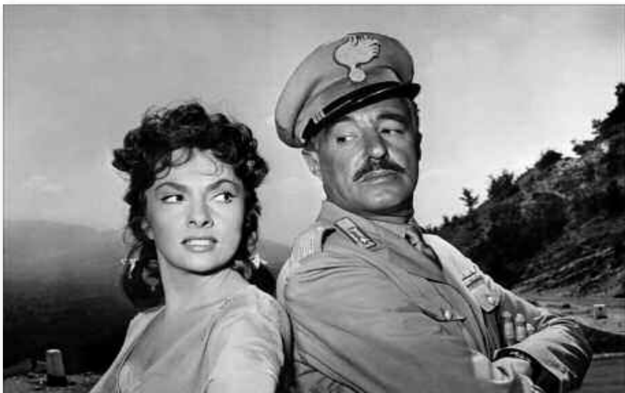
Una immagine indimenticabile del cinema italiano: Vittorio De Sica con Gina Lollobrigida

lontana intervista televisiva ha ricordato le sue preferenze per il Pci. Probabilmente però, come testimonia questa lettera, all'interno della sinistra non aveva una collocazione ben definita. Era in sostanza un progressista in un'Italia che da un punto di vista sociale di progresso ne aveva visto sino a quel momento ben poco, oppressa da quel forte odore di incenso e sacrestia che la Dc aveva diffuso dalle Alpi allo Stretto di Messina. Era ancora l'Italia della censura, delle gambe delle gemelle Kessler che dovevano essere esposte con grande discrezione, degli stessi film che dovevano seguire