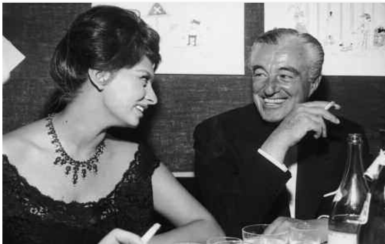
Vittorio De Sica insieme alla straordinaria Sophia Loren

Roma, insomma, era una città decisamente "bianca". Nelle elezioni del 1960 la Dc aveva conquistato quasi il 34 per cento dei voti mentre il Pci si era fermato al 23. Il terzo partito era stato il Msi con il 15,2 mentre il Psi non era andato oltre il 13,1.