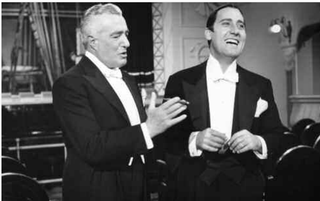
De Sica con un altro grandissimo del nostro cinema: Alberto Sordi

ormai da molti anni faticosamente apriva la strada al nuovo (il centro-sinistra) e nelle piazze cominciavano a romoreggiare i primi movimenti di contestazione (due anni prima, c'era stata la rivolta contro il go-